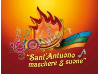
Logo Carnevale Palmese Festa Sant'Antuono

Domenica 17 gennaio 2010 il primo appuntamento del Carnevale di Palma Campania: fra sacro e profano, un allegro anticipo della festa dove si può tutto e il contrario di tutto.